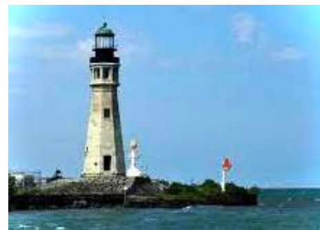
Mon phare précédent est le Buffalo Main Lighthouse, aux USA.