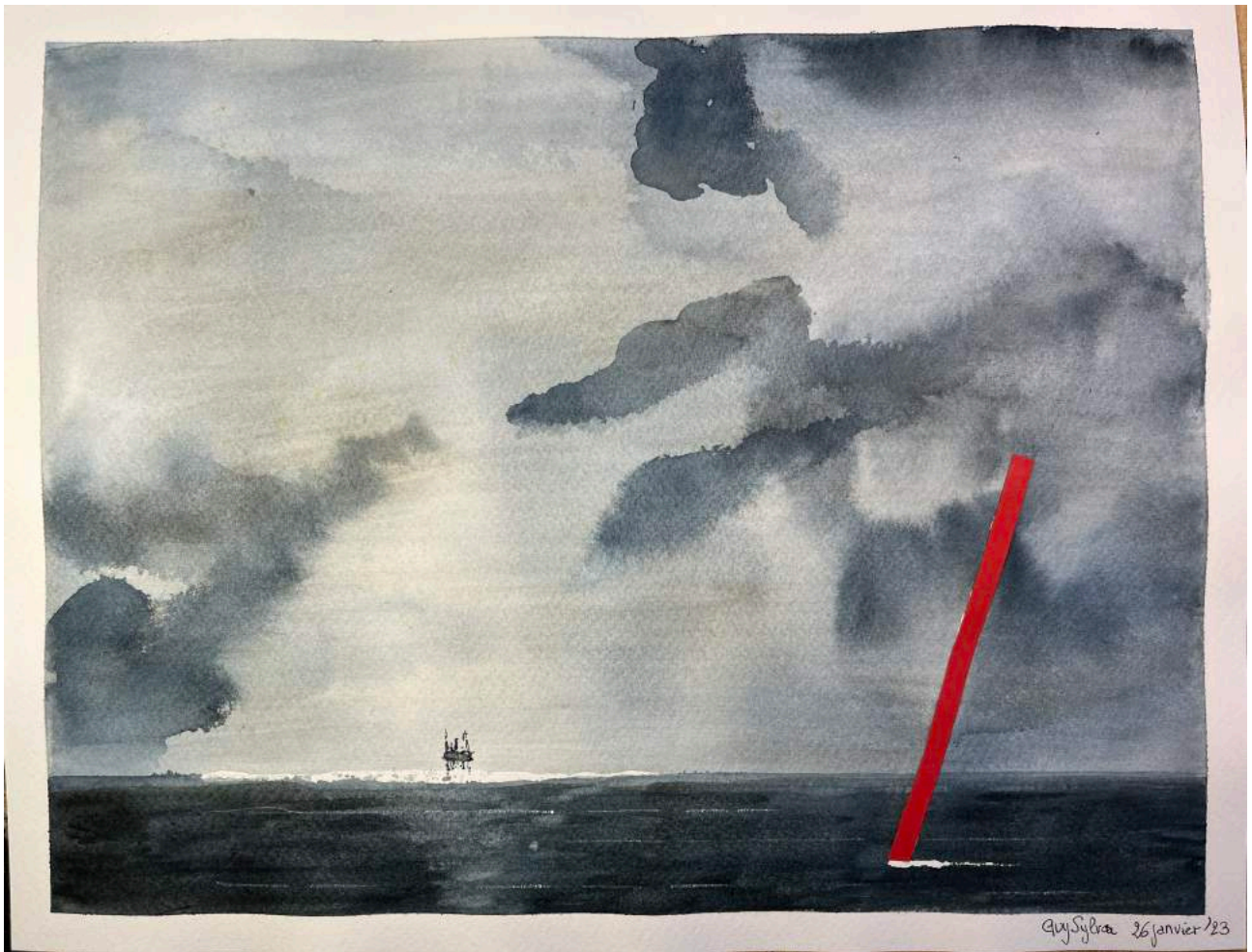
Plateforme en mer.