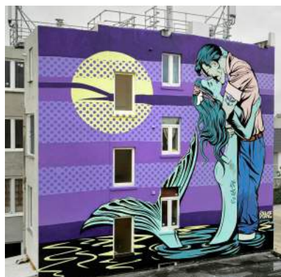
À gauche Ostende, Au dessus Gand