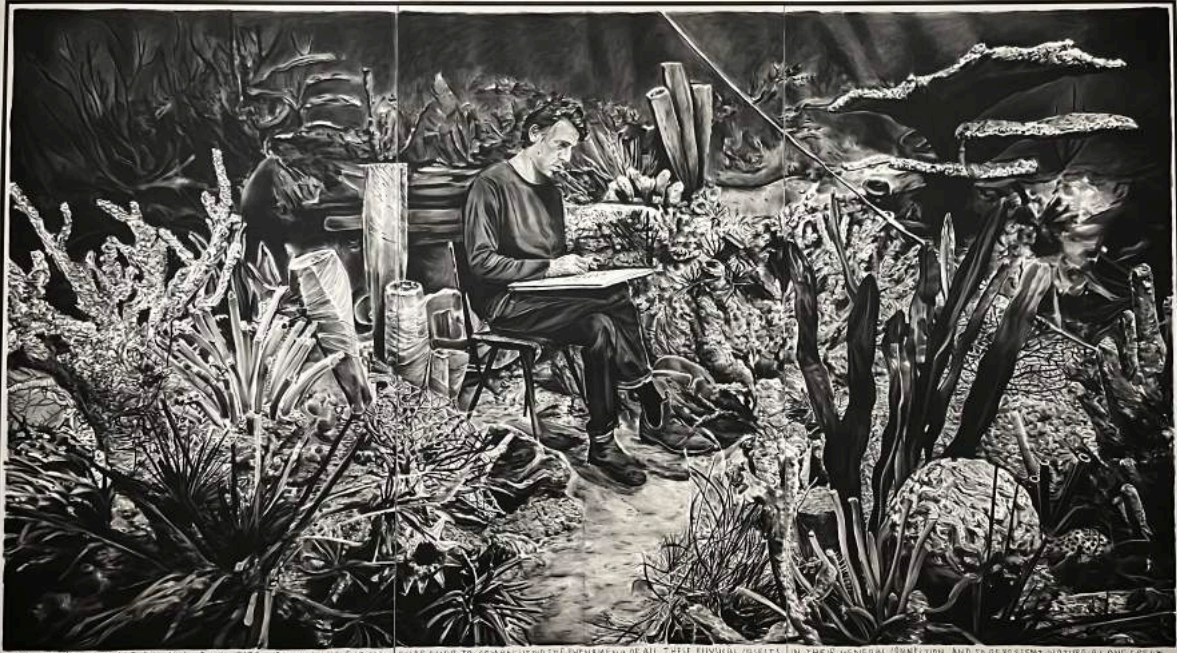
THE FAIRCHILD TRAVELER BY WHICH I WAS DIRECTED WAS THE FACTORY ENDEAVOR TO COMPREHEND THE MEANING OF ALL THESE TROPICAL SUBJECTS IN THE GENERAL CONNECTION AND TO REPRESENT NATURAL AS ONE GREAT WHOLE. PHOTOGRAPHED BY THE GARDEN OF BOTTLE-GROWING HOUSE FOR THE SUPPLY OF THE U.S. GEOLOGICAL SURVEY. THE PHOTOGRAPH WAS TAKEN IN 1892 AT THE GARDEN OF BOTTLE-GROWING HOUSE FOR THE SUPPLY OF THE U.S. GEOLOGICAL SURVEY.