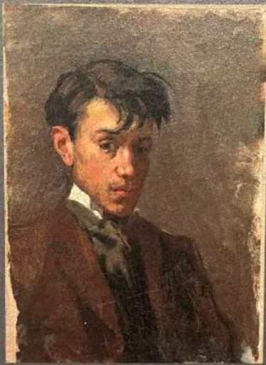
Pablo Picasso Autoportrait Barcelone, 1896, Huile sur toile

Museu Picasso, Barcelona Don de l'artiste, 1970, MPB 110.076 © Succession Picasso