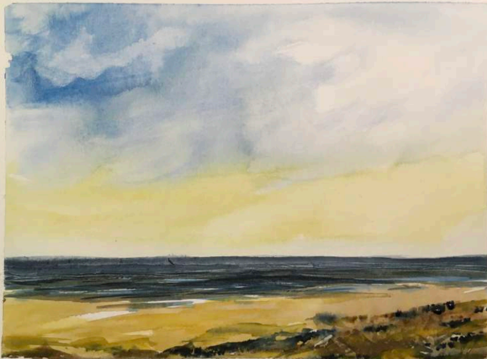
Zomer op het strand