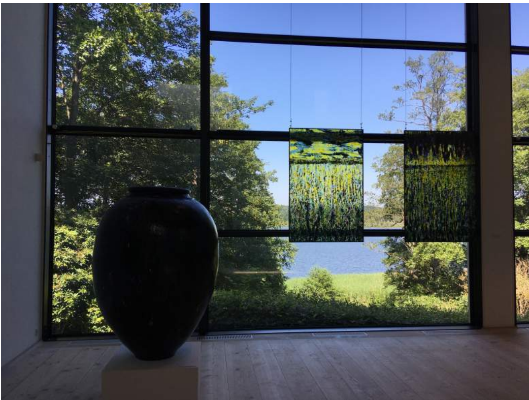
Lettre de Gand, en pérégrination. Dimanche, le 18 juillet 2021 Guy