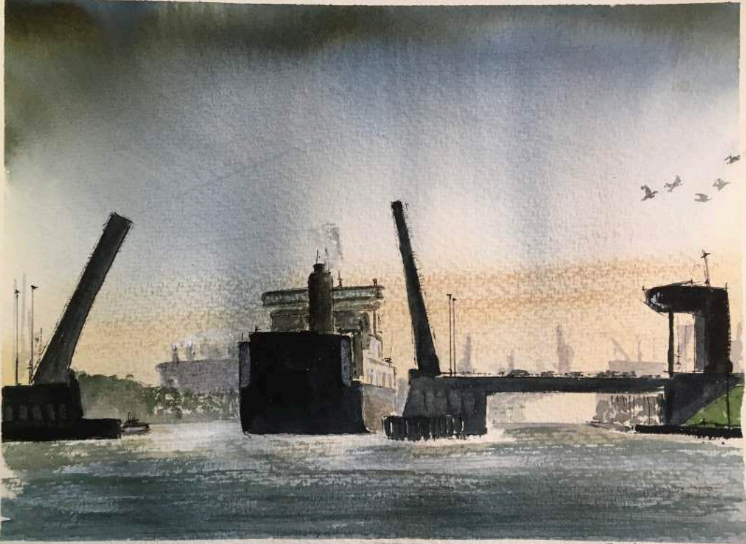
Zelzate Brug richting Gent