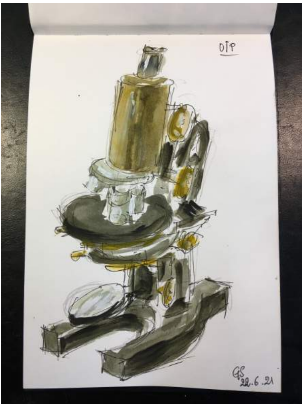
Lettre de Gand 21/26 Dimanche, le 27 juin 2021 Guy

Le mot pandémie fut prononcé pour la première fois, le 11 mars 2020, il y a de cela 473 jours.